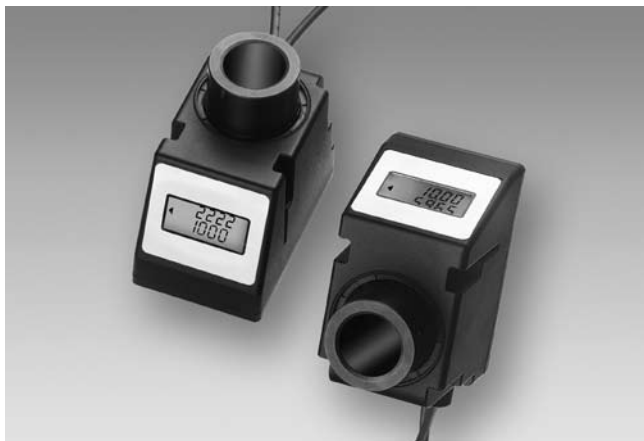
N 140 mit Kabelabgang